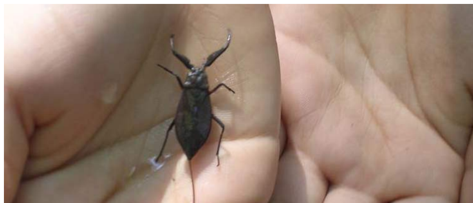
Nepa cinerea insetto comune d'acqua dolce chiamato "scorpione" d'acqua.

Per prima cosa è necessaria una compostiera , facilmente reperibile in commercio, oppure da costruire coinvolgendo possibilmente gli alunni. Si possono costruire compostiere anche utilizzando materiali di recupero, come vecchi bidoni dell'immondizia opportunamente forati su tutti i lati, fondo compreso. Una volta creata la compostiera, si pone sul suo fondo dell'argilla espansa aggiungendo un po' di rametti secchi (per drenare) e poi si possono iniziare a inserire gli scarti alimentari (per esempio quelli della mensa scolastica). Un buon compost deve essere costituito sia da una frazione umida (scarti di frutta e verdura e di cibo in genere) che da una frazione secca (foglie e rametti, quindi reperibili in giardino). Nel giro di qualche mese il compost sarà pronto per essere usato; ricordate, quando lo prelevate, di lasciarne sempre una piccola quantità nella compostiera per velocizzare la formazione di quello successivo.