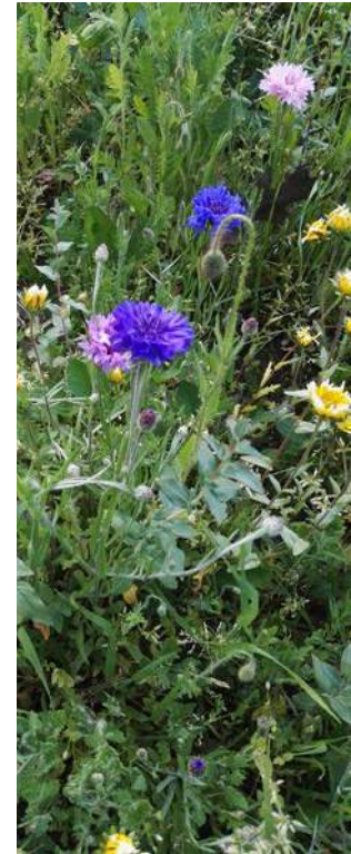
Fioritura di fiori di campo.

http://assets.wwf.it/panda.org/downloads/report_urban_nature_finale_nov.pdf