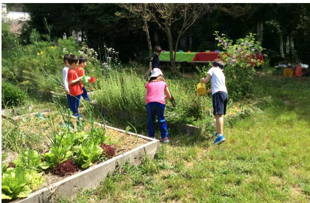
Hortus Urbis, l’orto antico romano nel Parco dell’Appia Antica.