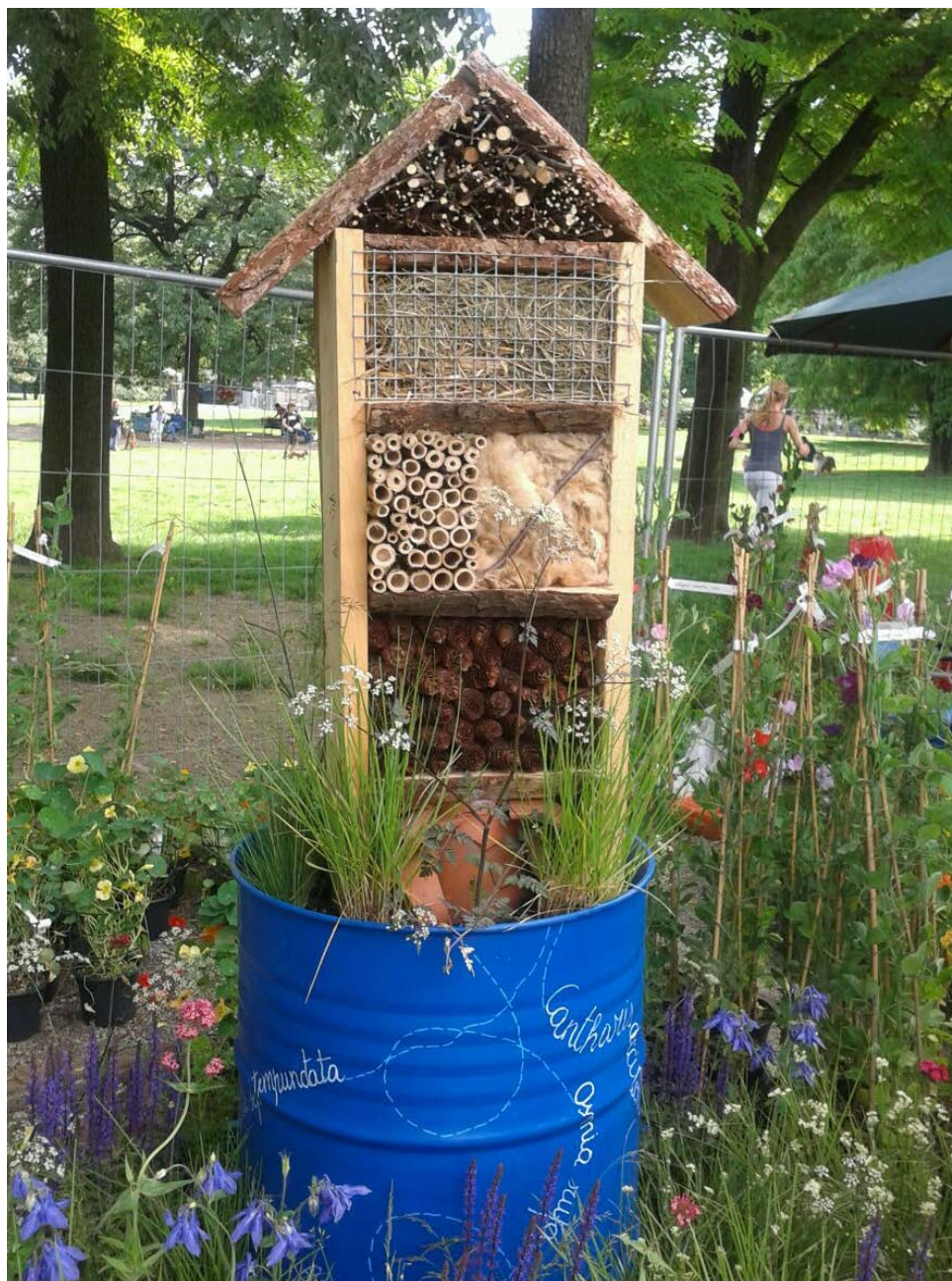
Condominio per insetti.