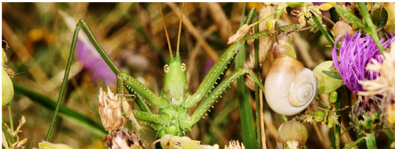
Saga pedo o stregona dentellata uno dei più grandi insetti europei.