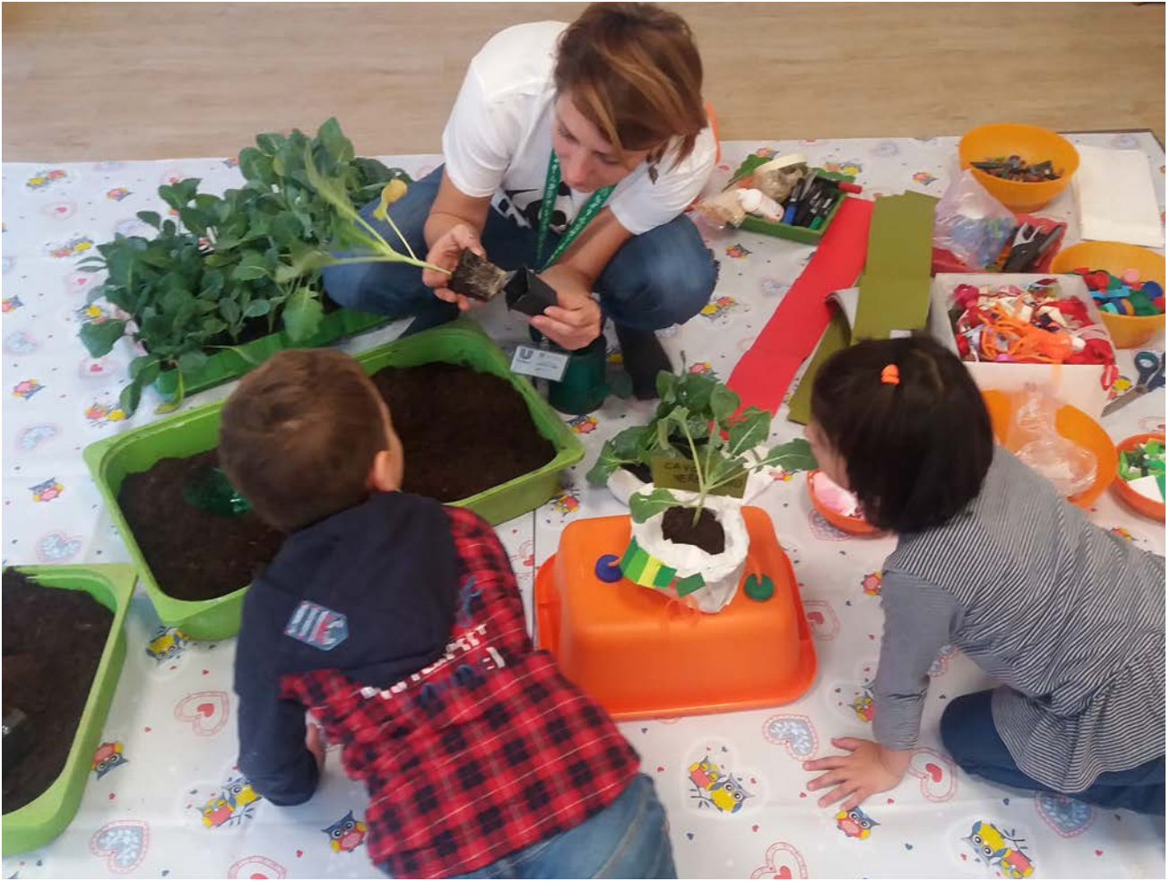
Laboratorio per fare un orto piccolo piccolo.