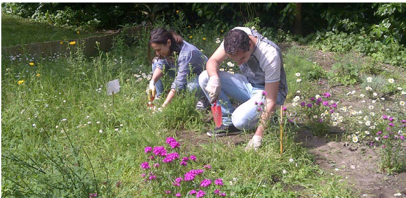
Giardino per le farfalle.